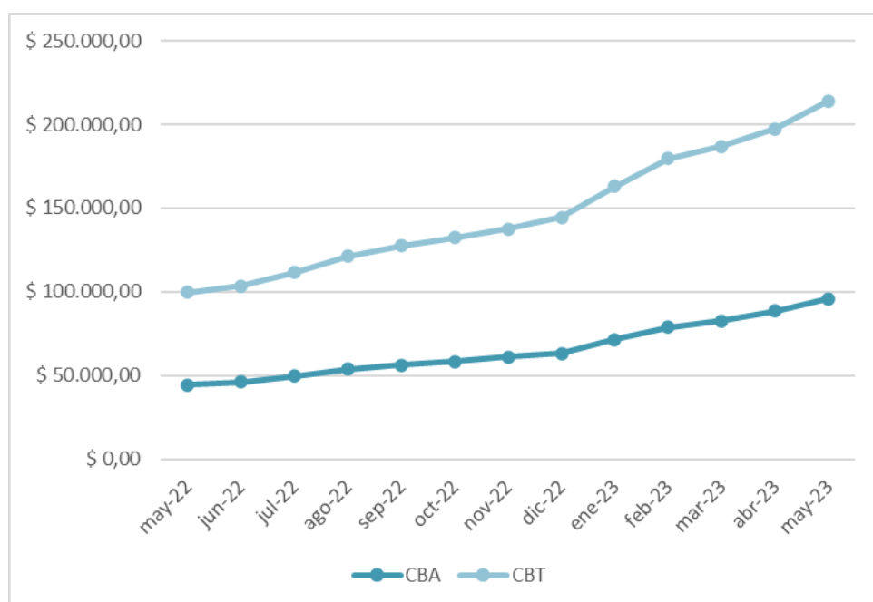
Gráfico 1: Evolución de CBA y CBT. MAYO 2022/ MAYO 2023